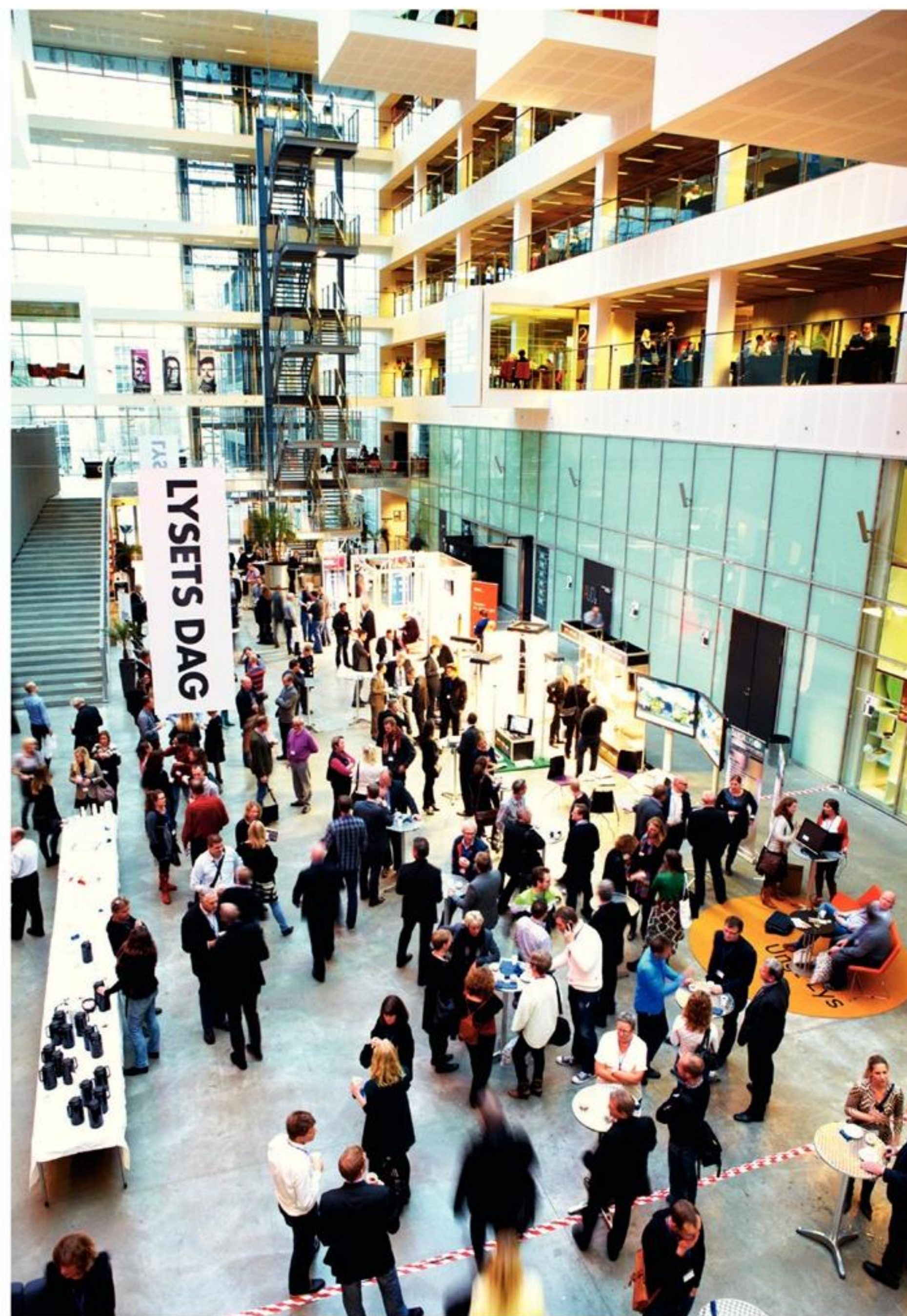
Der var 250 deltagere på lysets Dag 2011, som fandt sted på IT-Universitetet i København.

Magic Monkey fra Belgien ledet af Marc Largent og Daphné