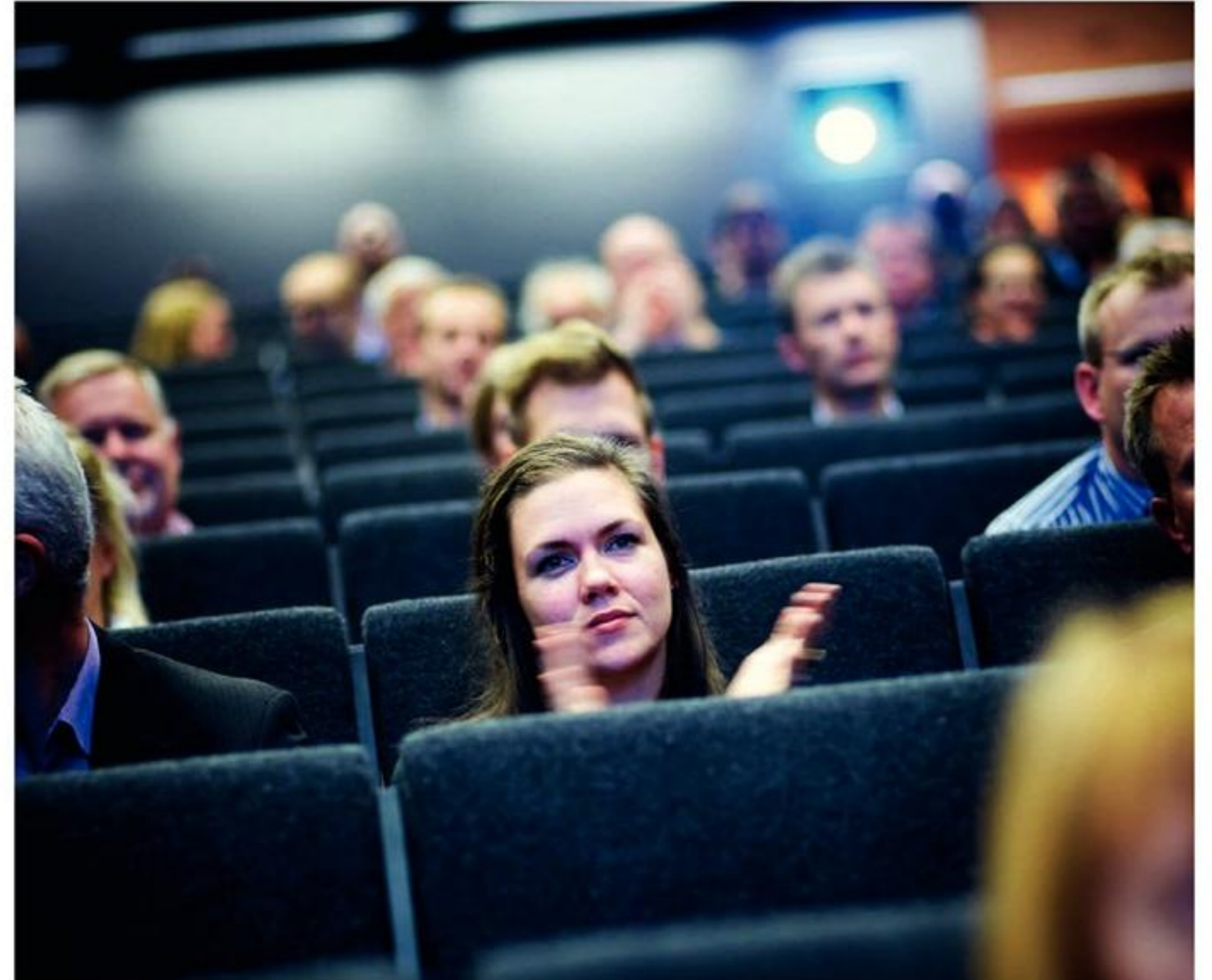
Tilhørerne lyttede intenst til de mange spændende indlæg.