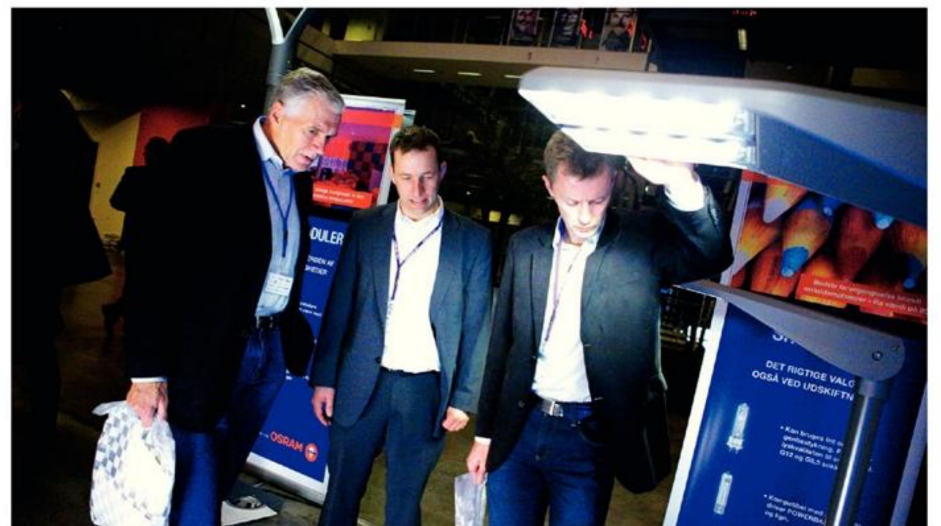
Besøgende på Osrams stand.