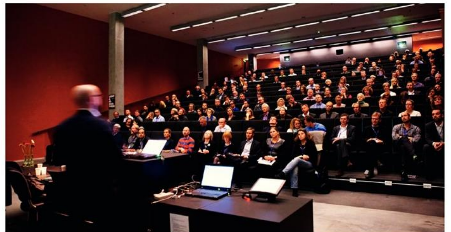
Det var femte i gang i år, at Dansk Center for Lys arrangerede Lysets Dag.